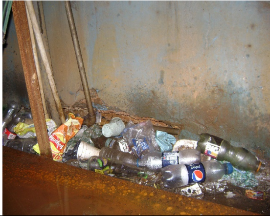
Foto No. 5 – Vista de perforación identificada con código pz-11-0090 – Estado Activo