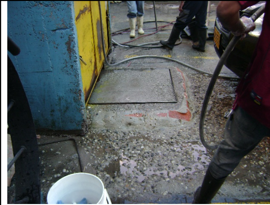
Foto No. 1 – Vista de placa de tanque subterráneo donde se re-circula el agua extraída del pozo identificado con código pz-11-0090