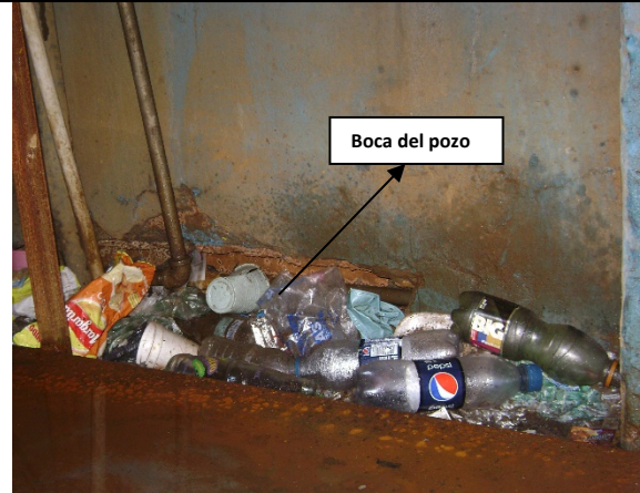
Foto No. 6 – Vista de boca del pozo identificado con código pz-11-0090

De acuerdo con el último Concepto Técnico emitido No 20331 del 27/11/2009, producto de la visita de seguimiento realizada el 12/08/2009, se puede establecer que han cambiado las actuaciones técnicas, ya que en éste se informó que el pozo se encontraba inactivo y sellado temporalmente, las condiciones físicas y ambientales eran buenas, situación que se modifica en la diligencia técnica efectuada el 04 de diciembre de 2012, donde se evidencia totalmente lo contrario, como se expuso anteriormente y como se puede observar en el registro fotográfico.