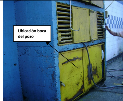
Foto No. 2 – Ubicación de la boca del pozo identificado con código pz-11-0090.